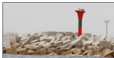
Marca lateral de bifurcación canal principal a estribor