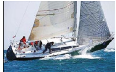
Al navegar contra el viento y las olas el cabeceo se intensifica hasta dar, como en la imagen, un pantocazo.