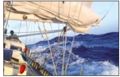
Mar formada de través al sur de las Islas Canarias. El oleaje es el causante fundamental del balance

Cuando afrontamos la mar de proa o de popa y el barco cabecea, por las mismas causas expresadas con el balance, el barco puede entrar en sincronismo, que en este caso se denominaría sincronismo longitudinal .