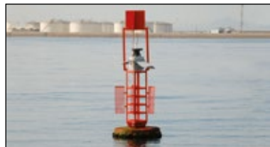
Marca lateral de babor de color rojo

Si en la bifurcación, el canal principal está a babor, la marca lateral de bifurcación será de forma cónica , de castillete o espeque, de color verde , con tope cónico verde y llevará una franja roja en el centro de la marca, indicativa de que el canal principal está a babor. De noche, la luz será verde y la fase 2+1 destellos .