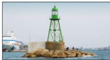
Marca lateral de estribor verde