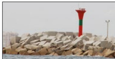
Marca lateral de bifurcación canal principal a estribor